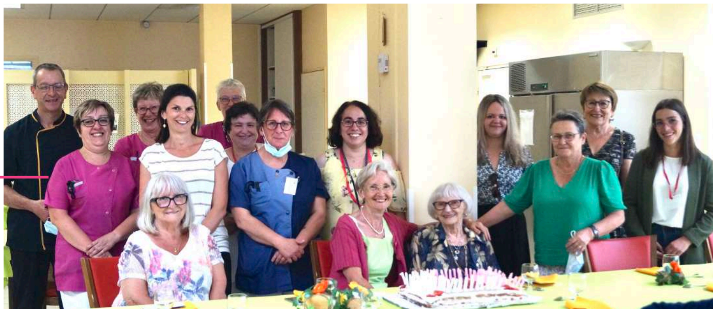
Anniversaire de Madame Conseil

Après deux années difficiles sur fond de crise sanitaire et pour la plus grande joie des résidents du Foyer Logement, les après-midis récréatifs ont repris !